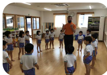
えいごであそぼう